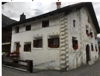
Ornements typiques d'Engadine

Temps de marche 2h00 environ (pauses exclues), dénivelé 265 m de D+, 135 m de D-.